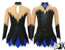
Exemples décolletés possibles